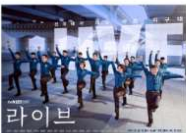
라이브 TVN 2018.03.10

우리도 시간이 흘러 흘러 그들의 나이가 될 것이다. 우리는 그들에 대해 얼마나 알까? 또 그들은 우리 젊은 청춘에 대해 얼마나 알까? 드라마의 의도처럼 정보의 부재에서 오는 거리감을 좁혀주는 드라마라 생각된다. 여전히 '살아있는 황혼 청춘들'의 드라마를 보면서 한바탕 눈물을 쏟고 나면 어느새 그들과 친구가 된 자신을 발견할 수 있다.