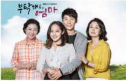
부탁해요 엄마 KBS2 2015.08.15

양속 같은 모녀지만 결국 엄마를 닮은 나를 발견하고 되돌아보는 스토리이다. 엄마와 싸워본 적 있는 딸들이라면 다 공감되지 않을까? 거기다 국민 엄마 고두심의 연기라니.. 눈물 흘리는 건 당연. 드라마를 정주행하고 나면 엄마에게 나의 엄마가 되어줘서 고맙다고 전하고 싶어 질 것이다.