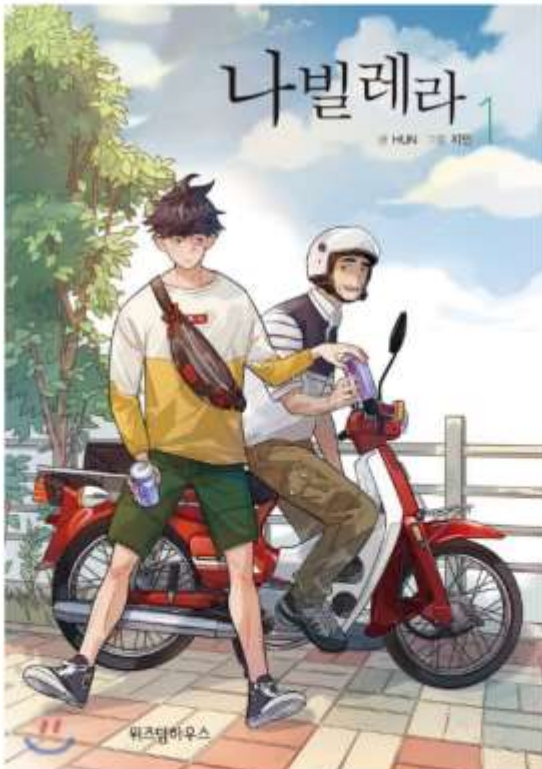
나빌레라 다음웹툰, 글 Hun | 그림 지민

발레리노라는 같은 꿈을 꾸는 일흔의 할아버지와 스물셋의 청년의 이야기이다. 작가가 도대체 인생 몇 년 차길래 이런 스토리를 만들 수 있느냐는 독자들의 놀라움이 가득한 웹툰이다. 포근한 그림체와 인생을 관통하는 할아버지의 명언들 덕분에 단행본 소장도 추천한다. 만화를 넘어 인생 견습서 같은 느낌을 주는 이 웹툰은 두고두고 당신의 눈물샘을 자극할 것이다.