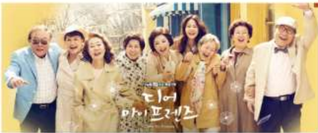
디어 마이 프렌즈 TVN 2016.05.13

양속 같은 모녀지만 결국 엄마를 닮은 나를 발견하고 되돌아보는 스토리이다. 엄마와 싸워본 적 있는 딸들이라면 다 공감되지 않을까? 거기다 국민 엄마 고두심의 연기라니.. 눈물 흘리는 건 당연. 드라마를 정주행하고 나면 엄마에게 나의 엄마가 되어줘서 고맙다고 전하고 싶어 질 것이다.