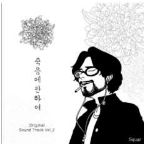
죽음에 관하여 네이버 웹툰, 글 시니 | 그림 혀노

발레리노라는 같은 꿈을 꾸는 일흔의 할아버지와 스물셋의 청년의 이야기이다. 작가가 도대체 인생 몇 년 차길래 이런 스토리를 만들 수 있느냐는 독자들의 놀라움이 가득한 웹툰이다. 포근한 그림체와 인생을 관통하는 할아버지의 명언들 덕분에 단행본 소장도 추천한다. 만화를 넘어 인생 견습서 같은 느낌을 주는 이 웹툰은 두고두고 당신의 눈물샘을 자극할 것이다.